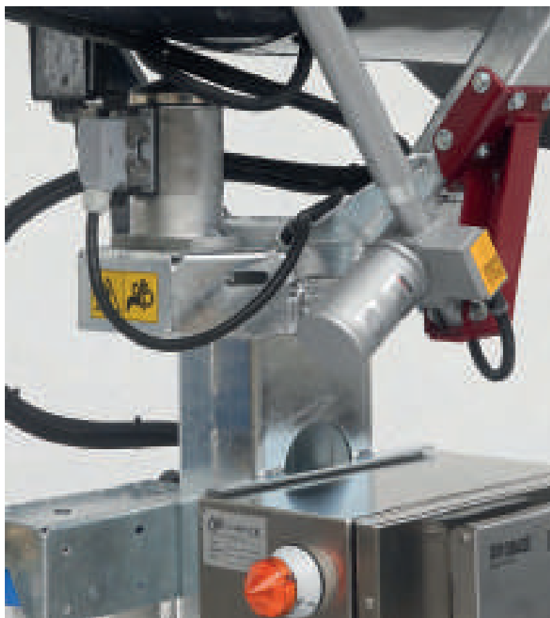
Sistema di alzo e brandeggio