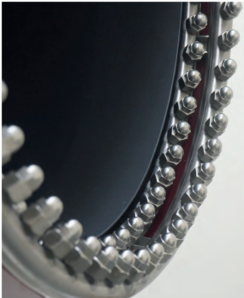
Corona con 110 ugelli per ottenere goccioline con diametro da 18 a 20 micron