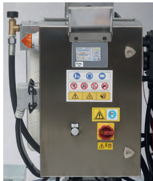
Touch screen 4.3"