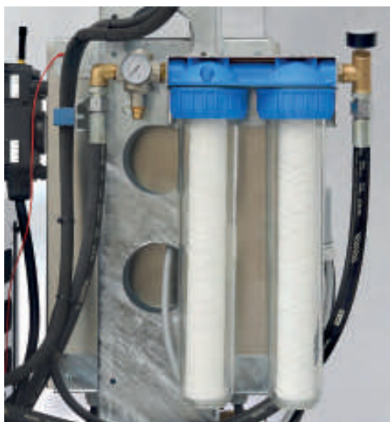
Kit ingresso acqua