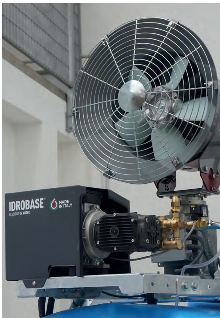
Dettaglio modulo con pompa 3 pistoni ceramica