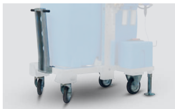
IT.2047 - Kit ruote (optional)