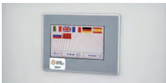
Touch screen da 4,3" con software multilingue