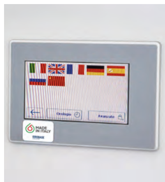
Quadro comandi completo di PLC e touch screen per gestione modulo, 7 lingue disponibili