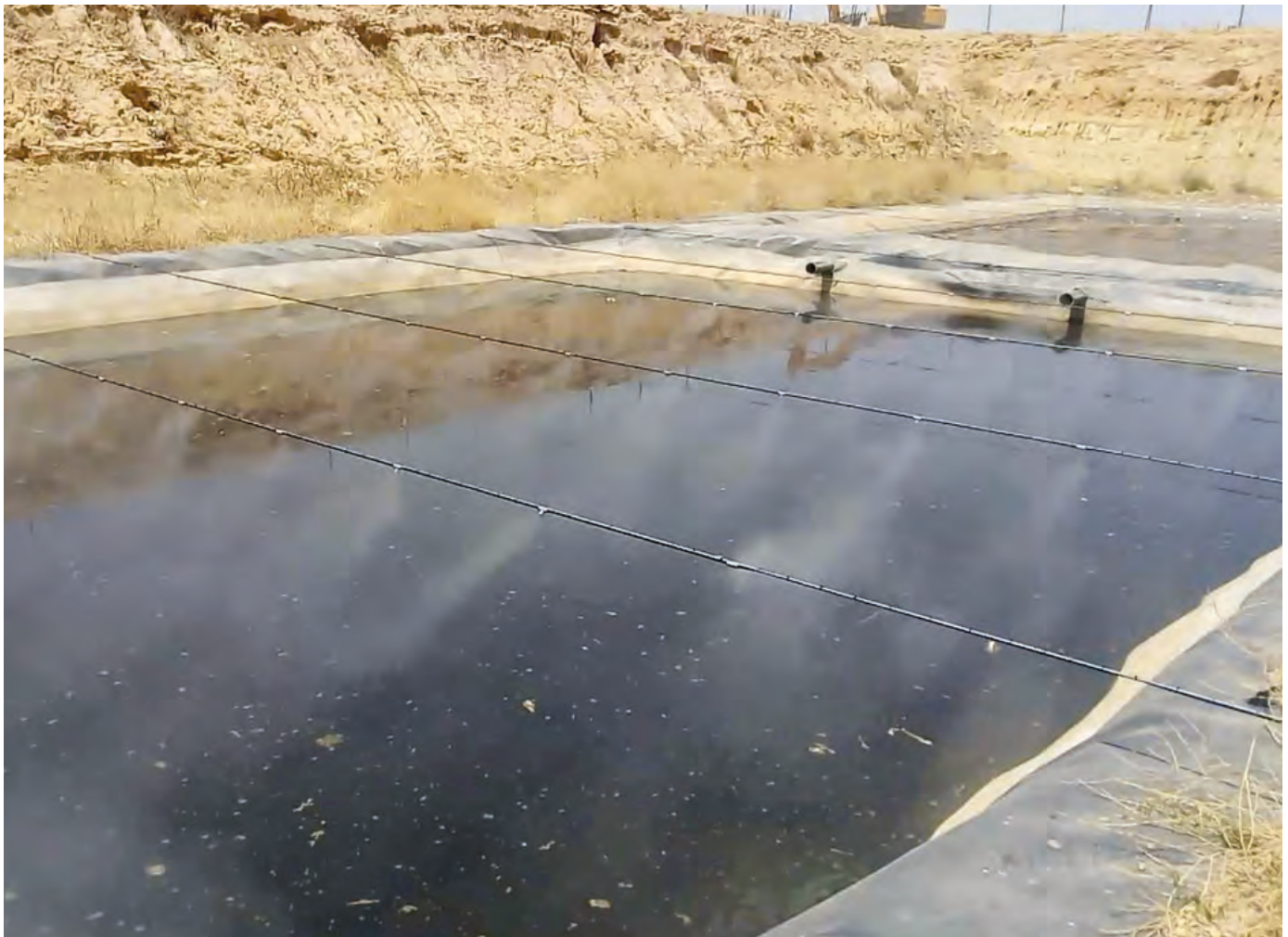
Odor suppression - Algeria

NEW INCLUSO Set manutenzione pompa 750ore