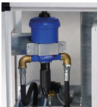
Dosatore meccanico proporzionale 0,2-2%